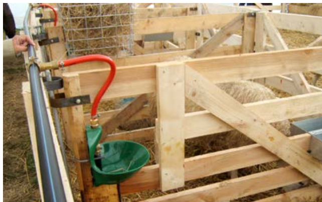
Des cases installées le long d'un couloir latéral

Pour équiper 20 cases d'agnelage déjà en place, compter environ 500 € hors taxes tout compris, soit 25 € par case. Le prix d'une case d'agnelage neuve en bois avec abreuvoir (un pour deux cases) est de l'ordre de 50 € sans la ligne d'eau.