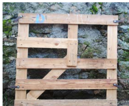
Une case d'agnelage d'un mètre avec emplacement pour le passage de tête des brebis à l'abreuvoir