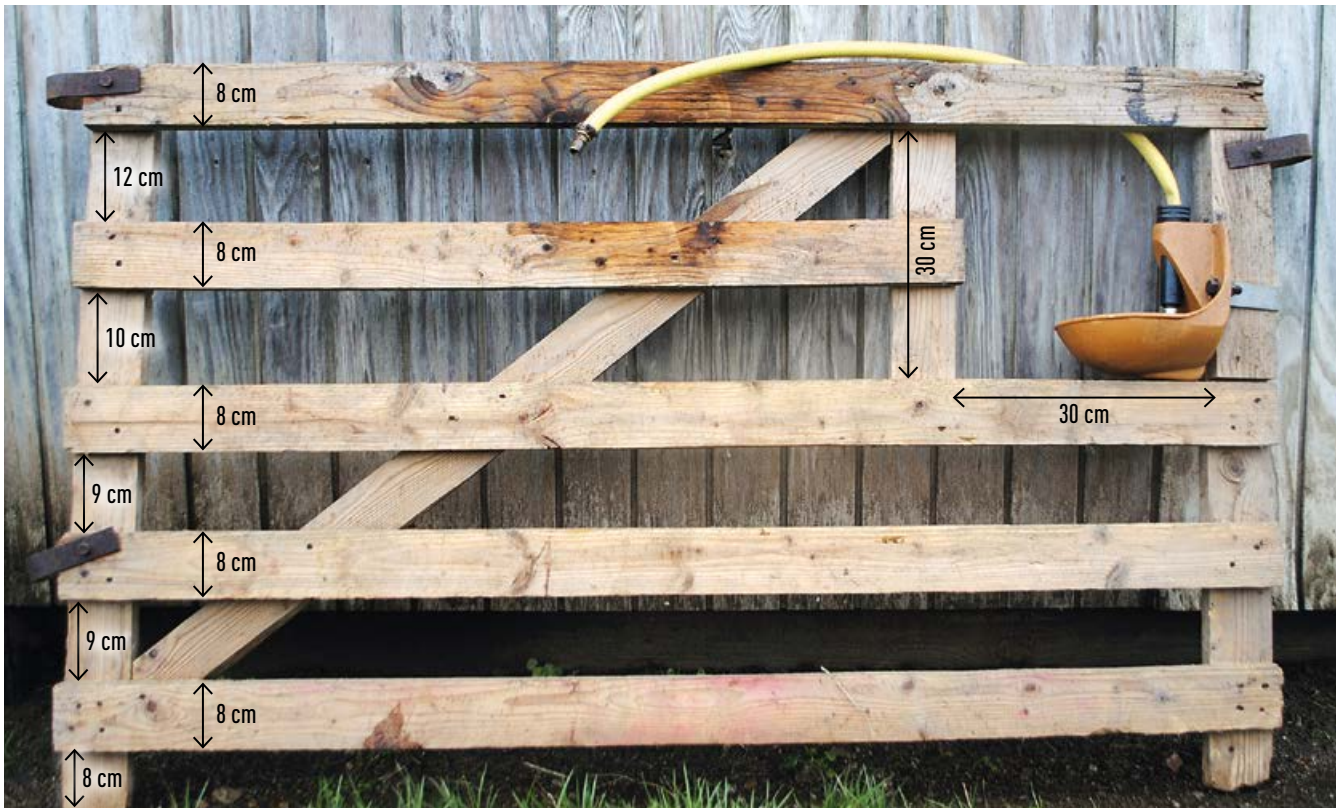
Une case d'agnelage de 1,50 m avec abreuvoir intégré