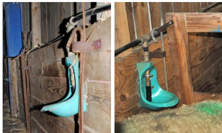
Les abreuvoirs sont fixés sur le bardage avec anneaux et fiches pour attacher les cases (ici, avant et après le montage des cases d'agnelages)

L'une des solutions afin que la ligne d'eau ne gèle pas est d'installer un réchauffeur-accélérateur. Ce dernier peut alimenter tous les abreuvoirs de la bergerie. Le circulateur met l'eau en mouvement, ce qui nécessite un réseau en boucle. Les abreuvoirs et les canalisations exposées au froid sont ainsi mis hors gel. Le circulateur peut être associé à un réchauffeur. Pour 100 mètres de circuit, le prix indicatif d'un réchauffeur-accélérateur est de l'ordre de 1 270 € hors taxes et hors montage. La qualité de l'installation conditionne le bon fonctionnement de ce système qui reste consommateur d'électricité. Les abreuvoirs à niveau constant ne peuvent pas convenir à ce type d'installation.