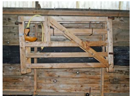
Un système de rangement des claies dans la bergerie pour les avoir toujours à portée