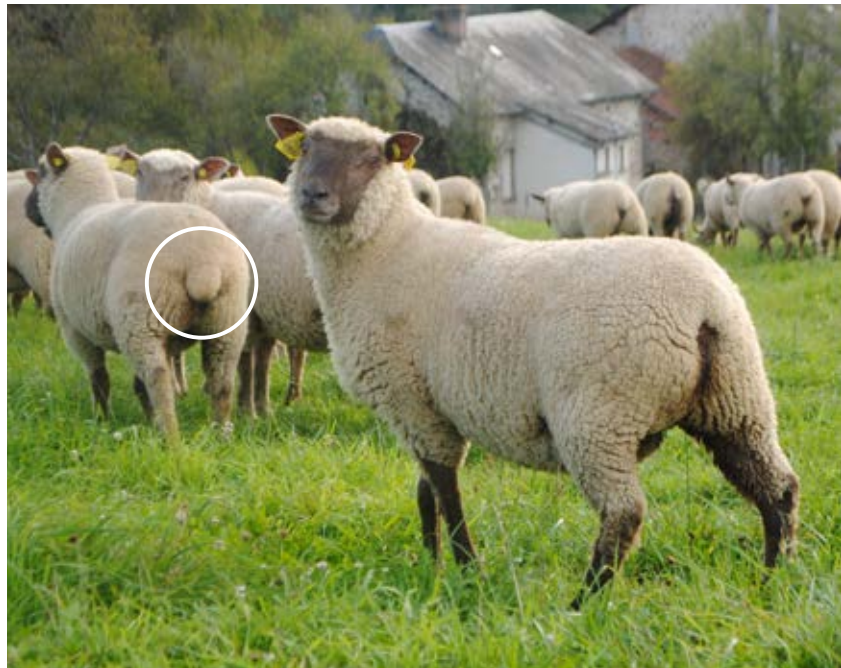
Au premier plan, une agnelle avec la queue coupée trop court. À sa gauche, la queue est à la bonne longueur, c'est-à-dire à 3 vertèbres de la base de la queue.