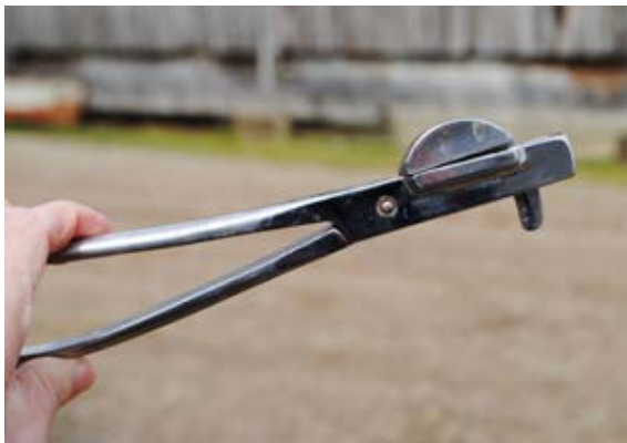
La pince hémostatique