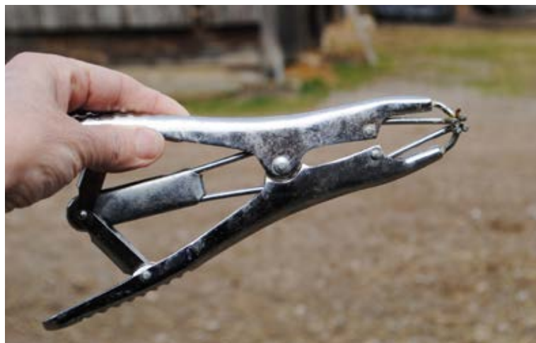
La pince spéciale pour poser les anneaux de gomme

Les recommandations du Conseil de l'Europe préconisent l'utilisation de méthodes chirurgicales précédées d'anesthésie ou l'utilisation de la pince hémostatique.