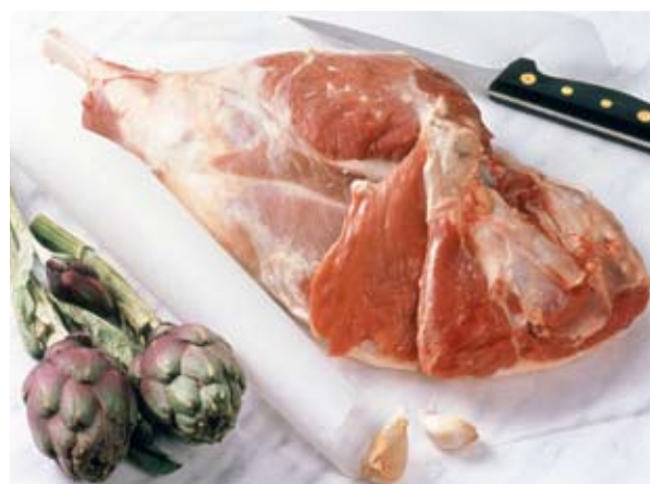
Issus de pères améliorateurs, les agneaux nés sur IA présentent des carcasses de meilleure qualité et sont mieux valorisés