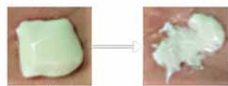
Grain pas coiffé

Le coiffage consiste à soumettre le grain à des perturbations physiques jusqu'à ce qu'une fine pellicule imperméable se forme à sa surface, limitant son égouttage et le rendant plus résistant à l'écrasement.