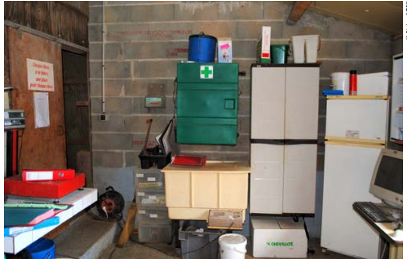
Un espace pour ranger le matériel nécessaire